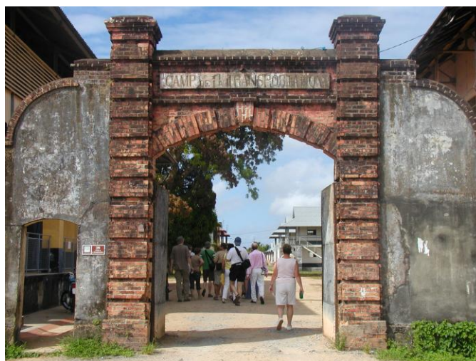
De bagne te Saint-Laurent du Maroni