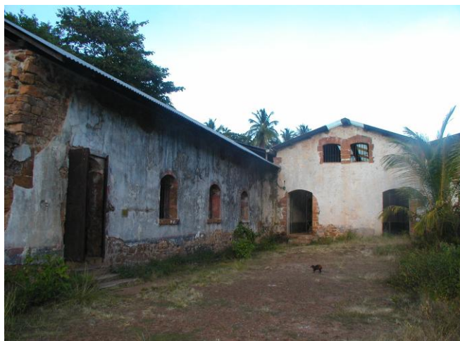
De ruines van de bagne op Duivelseiland

De Franse schrijver Émile Zola bracht echter alles in de openbaarheid met een artikel op de hoofdpagina van de krant l’Aurore getiteld “J’Accuse...!” in 1898. Zola werd dan door de minister van Oorlog aangeklaagd wegens laster en veroordeeld tot een jaar gevangenisstraf en 3000 F boete waardoor Zola naar Engeland vluchtte.