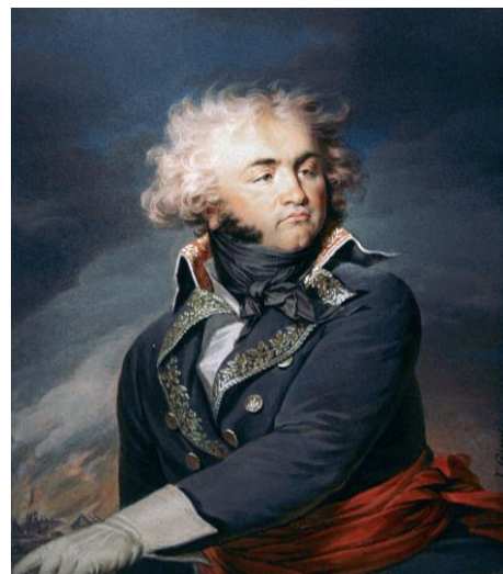
Generaal Jean-Baptiste Kléber

Na twee dagen van onafgebroken, zware beschietingen, kondigde generaal Kléber nog zwaardere bombardementen aan, waarop de burgers van de stad op 3 november 1794 bij de gouverneur aandrongen op overgave. Een dag later gaf de stad zich over en op 5 november ondertekende de prins van Hessen-Kassel de capitulatievoorwaarden. Een week eerder was brigadegeneraal Laurent erin geslaagd Venlo te