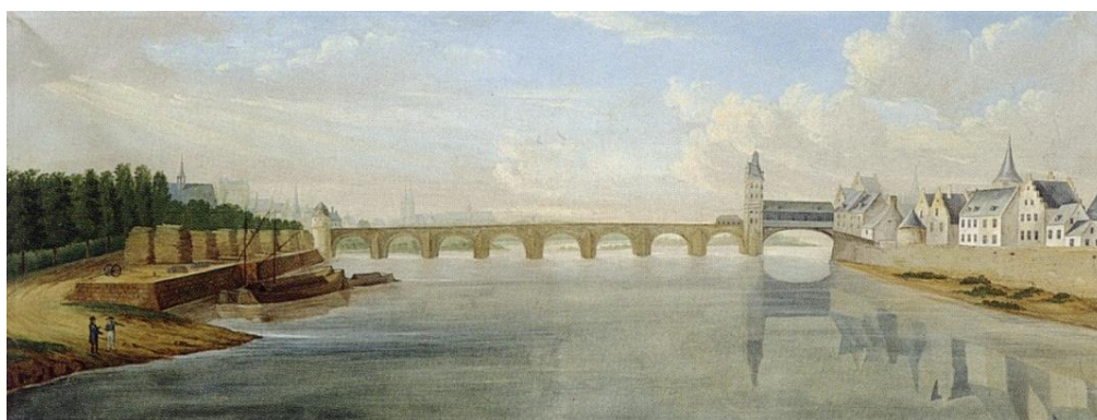
Zicht op de Sint-Servaasbrug met de poorttoren te Maastricht. Olieverfschilderij toegeschreven aan de militaire ingenieur kapitein Van den Heuvel, 1793

In de zomer van 1794 voerde Frankrijk de algemene dienstplicht in en slaagde er op die manier in om een volksleger van meer dan een miljoen soldaten op de been te brengen. Spoedig waren de Fransen weer aan de winnende hand. De Slag bij Fleurus (Henegouwen) op 26 juni 1794 betekende het keerpunt in de Zuidelijke Nederlanden. Precies een maand later trokken de Franse revolutionaire legers zegevierend de stad Luik binnen. In de nazomer van 1794 werd het Land van Loon veroverd, waarbij vele plunderingen op het Loonse platteland plaatsvonden. Aken viel op 22 september. Ook de Brabantse, Luikse, Gelderse en Gulikse steden langs de Maas vielen een voor een, waarbij Venlo nog het langst (tot 26 oktober) verzet wist te bieden.