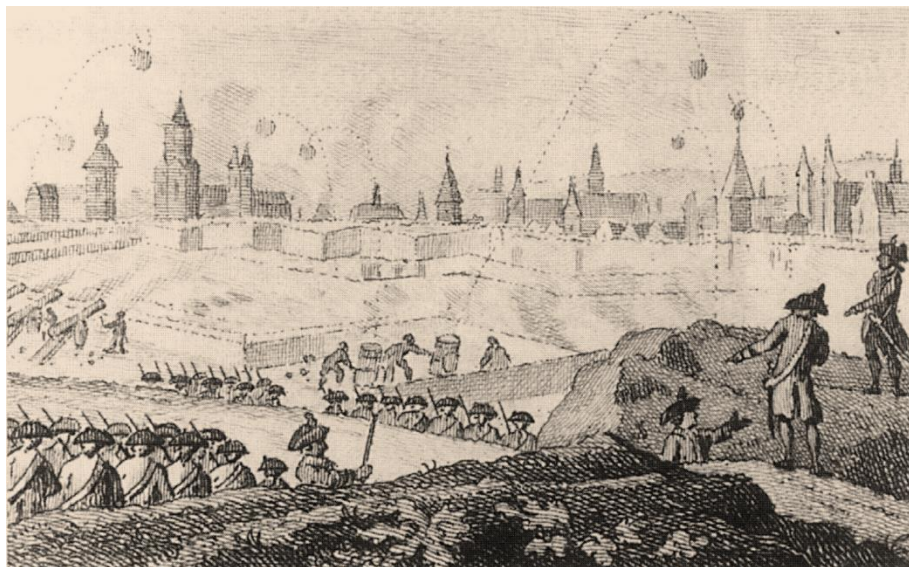
Beleg van Maastricht in 1793 door Francisco de Miranda, tekening van Jacobus Buys, 1795

In 1792 verklaarde de Eerste Franse Republiek de oorlog aan de Habsburgse monarchie, waarmee de Eerste Coalitieoorlog (1792-1797) begon. In juli 1792 trokken revolutionaire troepen de Oostenrijkse Nederlanden, het prinsbisdom Luik en Staats-Brabant binnen. In december 1792 viel Roermond in handen van de Franse luitenant-generaal Francisco de Miranda. Twee maanden later vond het beleg van