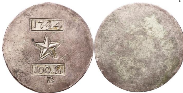
100 stuiver 1794 Maastricht, zilver Ø 41 mm, 30,4 g