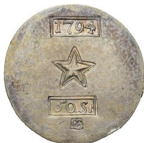
50 stuiver 1794 Maastricht

Het was de bedoeling om munten van 100, 50, 20, 10 en 5 stuivers te vervaardigen. Slechts de eerste twee werden effectief geslagen en kwamen in omloop. “Op de ene zijde van de noodmunt zag men het wapen [ster] van Maastricht. Bovendien de waarde van het stuk en het jaar 1794. De andere zijde was glad en de rand gekarteld”.