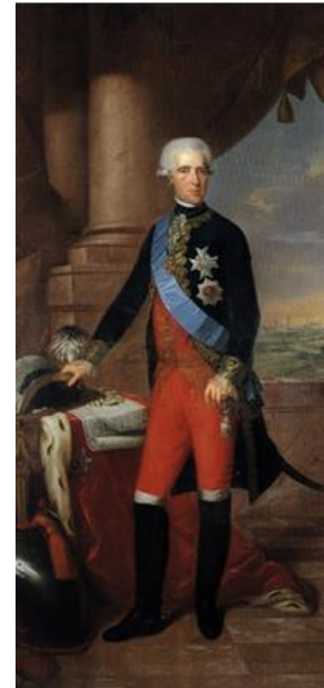
Frederik van Hessen-Kassel

Op 19 september, een dag na de slag bij Sprimont, arriveerde een Franse legermacht van circa 35.000 manschappen bij Maastricht onder leiding van de Franse generaal Jean-Baptiste Kléber (1753-1800). Het Maastrichtse garnizoen trachtte het beleg te voorkomen door een uitval te doen in die richting. Op de Louwberg kwam het eind augustus tot een treffen. Daarmee kon niet worden voorkomen dat de Fransen begonnen met de aanleg van naderingsloopgraven.