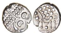
1. Cranborne Chase silver stater, ABC 2157. Good VF. Estimate £600

But every coin tells a story. All of these coins and many more, some extremely fine, some excessively rare will be offered by Chris Rudd at auction in Aylsham, Norfolk, on 15 March. For a free catalogue phone Sandra 01263 735 707 or email sandra@celticcoins.com