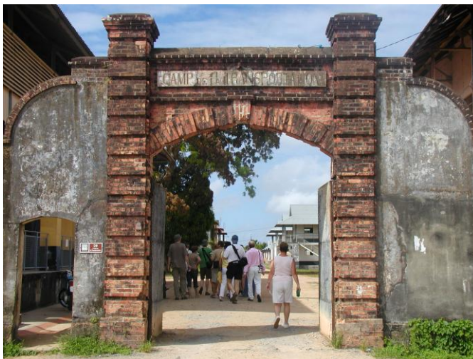
De bagne te Saint-Laurent du Maroni