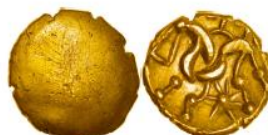
2. South Ferriby gold stater, ABC 1743 var. Near EF. Estimate £1000