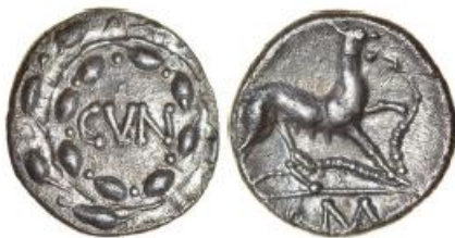
Cunobelinus Bitch and Snake, ABC 2891. Sold for £2,800

The next all-Celtic Chris Rudd auction will be held in Norwich on Sunday, 20 July 2025.