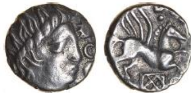
Dubnovellaunos Rochester Pegasus, ABC 318. Sold for £1,100

For more information contact Chris Rudd, tel: (44) 1263 735 007, email: liz@celticcoins.com If you publish the above news item, please send a copy of the magazine to: Chris Rudd, PO Box 1500, Norwich NR10 5WS, England.