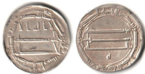
Dirham AR, al-Rashid ibn al-Mahdi, 190AH /805 AD , Muntplaats al-Muhammadiyya, 2.93 gr

In de periode 833-892 ondergingen de goud- en zilvermunten nog een standaardisatie. Elke munt moest de muntplaats, datum en de naam van de Kalief dragen, wat niet weglief dat men toch nog in sommige gevallen de naam van de mogelijke opvolger plaatste. De stempels werden centraal aangemaakt in Medinat al-Salam. Hierdoor mogen we stellen dat daar waar geen muntplaats op de munten voorkwam, deze in de hoofdstad werden geslagen. Het standaardgewicht bleef ongewijzigd voor de dinar. Uitzonderlijk, tijdens de regeerperiode van al-Ma'mûn zakte het gewicht naar 4.15 gr. Bij de dirhams varieerde het gewicht van 2.5 tot 3.3 gr. De kwaliteit voor beide muntsoorten was nog steeds goed. Na de dood van al-Wathîq in 846 gaat de kwaliteit bij de dirham sterk achteruit, te wijten aan het gebruik van versleten stempels. Tot in 864 werden de koperen munten nog enkel in lokale munthuizen geslagen.