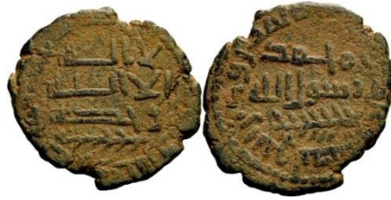
Fals, Mûsâ ibn 'Abd-allâh, 138 AH/ 755AD, muntplaats Halab (Aleppo), 4.01 g

Op enkele uitzonderingen na waren alle dinars en dirhams van een zeer goede kwaliteit. Koperen munten werden overvloedig uitgegeven, waarbij elk munthuis een eigen ontwerp en gewicht hanteerde.