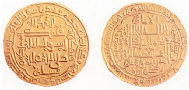
Dinar geslagen te Bagdad in 556 AH /1160AD

De analyse van Abbasidische munten vraagt, omdat het in Arabisch is, toch wel enige ervaring. In eerste instantie is het belangrijk dat men te weten komt waar en in welk jaar deze munt geslagen werd. Met deze gegevens kunnen we de heerser achterhalen. Al deze gegevens vinden we terug in de Bismillah 8 .