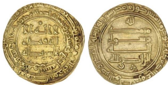
Dinar AV, Al Mu Tasim, 218-227AH / 833-841 AD, muntplaats Surr-Man-ra'a, eerste uitgifte van deze muntplaats

Tussen 892-945 kenden de goud- en zilvermunten nog een grotere aanpassing. Het standaardgewicht voor de dinar werd niet meer gehandhaafd waardoor het gewicht varieerde tussen 4.1 en 4.3 gr. Vanaf 932 vinden we zelfs gewichten van minder dan 3 gr tot 7 gr. De dirhams kregen cirkelvormige ornamenten op de voor- en keerzijde.