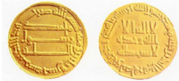
Een vroege Abbasidische dinar uit de periode 135-136 AH /752-753 AD

Na de overwinning op de Umayyaden bleven de Abbasiden het bestaande monetair systeem behouden.