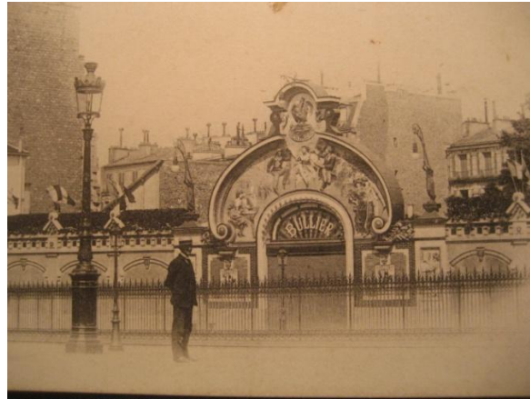
BAL BULLIER (PARIS – Av de l'observatoire 31)