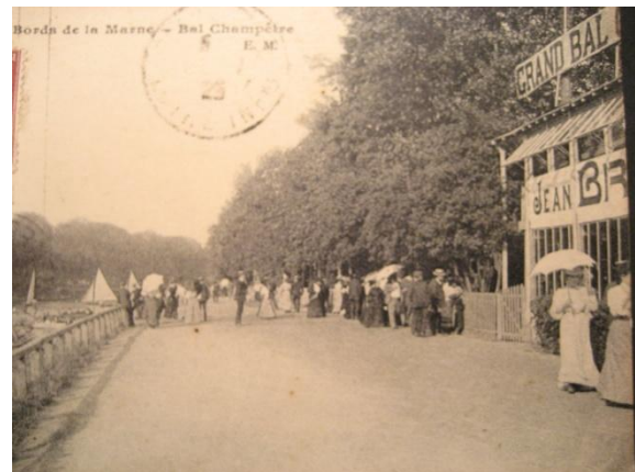
GRAND BAL CHAMPÊTRE (Bords de Marne)