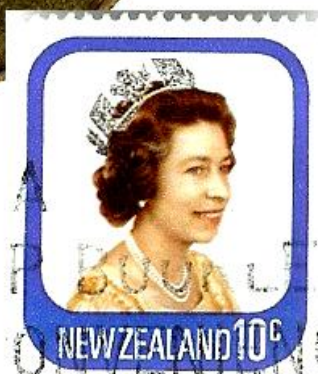
Koningin Elizabeth II (1926- ): 2 Dollars Nieuw-Zeeland 1998 Vz – postzegel 10 C

Deze bescheiden tentoonstelling is zeker niet exhaustief. Misschien kan ze voor sommigen onder ons, en wellicht zeker voor jonge, beginnende muntverzamelaars, een aanzet zijn om thematisch te werken. Het gebied van de numismatiek is immers toch zo uitgebreid!