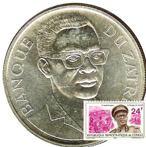
President Mobutu (1930-1997): 5 Zaires 1975 Vz - postzegel 24 F

Bovendien stellen ook filatelisten vast, dat postzegels niet ontsnappen aan «dezelfde wet». In bepaalde gevallen verplichten eigen wetten de afbeelding van het staatshoofd niet alleen op munten, maar eveneens op postzegels. Ook werden en worden postzegels door staatshoofden gebruikt – en door dictators zeker misbruikt – om zich aan de gemeenschap voor te stellen, vaak om zich op te dringen, hun naambekendheid te verspreiden. De titel van deze tentoonstelling spreekt dan ook voor zich: «Staatshoofden op munten en postzegels».