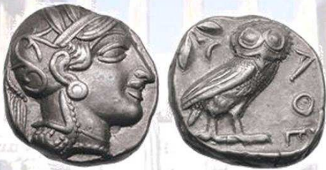
Zilveren tetradrachme van Athene (450-415 vC)

De uil, als symbool van wijsheid, onlosmakelijk verbonden met de stadsgodin Athena, verschijnt op Atheense munten om nooit meer te verdwijnen.