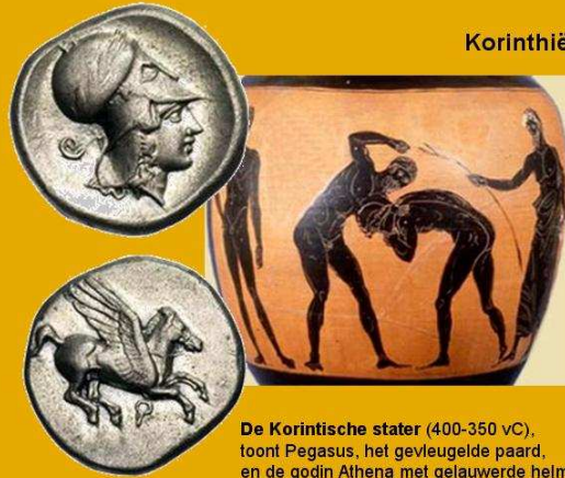
De Korinthische stater (400-350 vC), toont Pegasus, het gevleugelde paard, en de godin Athena met gelauwerde helm