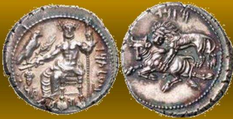
Zilver stater van Mazaios als satraat (359-336 vC)

Belangrijke muntplaats van de Perzische satrapen, de plaatselijke gouverneur