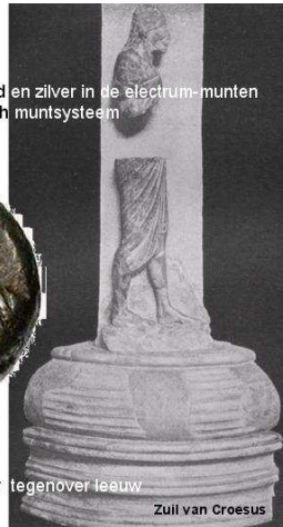
Zuil van Croesus