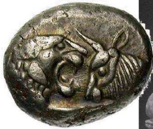
De Cresseide (500 vC): Croesus-stater met stier tegenover leeuw

Door de steeds wisselende verhouding van goud en zilver in de electrum-munten werd uiteindelijk overgegaan tot een bi-metallisch muntsysteem