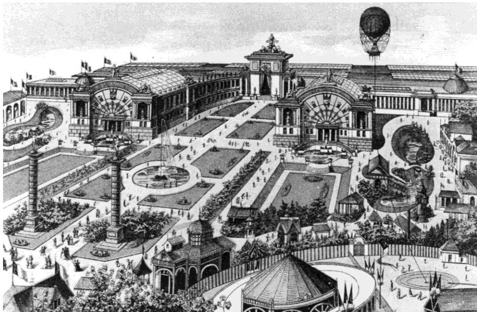
Zicht op de Nationale Tentoonstelling van 1880

Leopold II vond die ene boog maar niets en liet hem afbreken (hij was toch nog niet voltooid) met behulp van dynamiet en vervangen door een triomfboog met 3 bogen, zoals we die vandaag kennen. Deze werd gerealiseerd door de Franse architect Charles Girault (1851-1932) die het Petit Palais op de Champs Elysées te Parijs had gebouwd en werd maar voltooid in 1905. Parijs had immers zijn Arc de Triomphe ook met 3 bogen, en Brussel kon daar niet voor onderdoen. De triomfboog werd bekroond met een 6 meter hoog bronzen vierspan met Apollo en Mercurius, gemaakt door de kunstenaars Jules Lagae en Thomas Vinçotte.