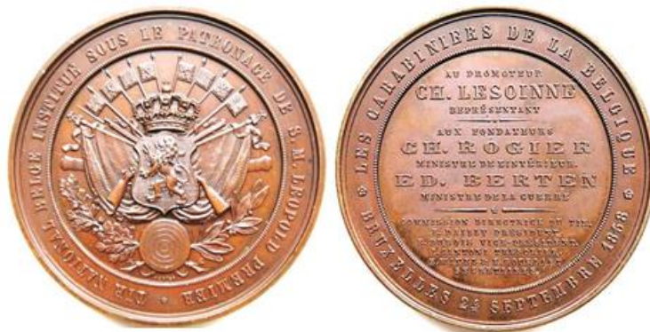
1858 - graveur: Wurden, Ø 55 mm, metaal: brons, zilver, goud

Langs de bovenrand: ☼ LES CARABINIERS DE LA BELGIQUE ☼ Langs de onderrand: BRUXELLES 24 SEPTEMBRE 1868